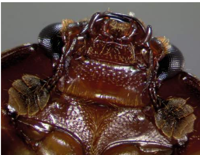
Abb. 4: Die keulenförmigen Fühler können zum Schutz eingeklappt werden.

Farbe: Unmittelbar nach dem Schlupf rötlich, später dunkel-braun bis schwarz (Abb. 4 und 5).