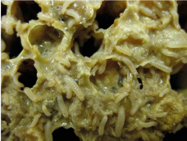
Abb. 9: Sehr stark befallene Brutwabe.

Waben: Leicht befallene Waben zeigen Fraßgänge der Larven sowie eine Verschleimung des Honigs. Stark befallene Waben brechen völlig zusammen (Abb. 9).