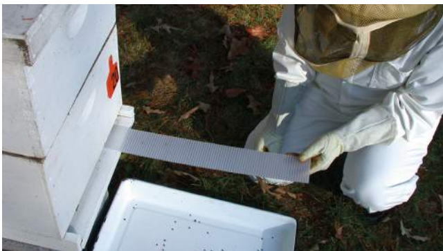
Abb. 2 a/b: Diagnose-Streifen sind sehr einfach in der Handhabung.