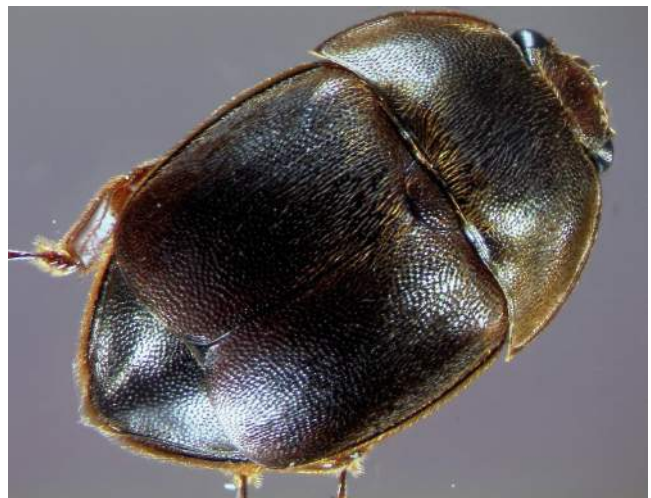
Abb. 5: Die Deckflügel sind kürzer als der Hinterleib.

Verwechslung: Der Glanzkäfer, Cychramus luteus , ein naher Verwandter des Kleinen Beutenkäfers, kann ebenfalls in Honigbienenenvölkern vorkommen. Im Gegensatz zum Kleinen Beutenkäfer sind diese Käfer jedoch harmlos und richten keine ernsthaften Schäden an. Aufgrund der großen Ähnlichkeit besteht leicht die Gefahr einer Verwechslung mit dem Kleinen Beutenkäfer.