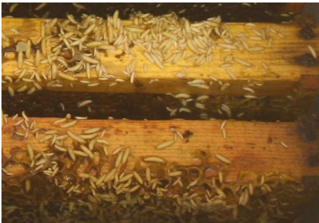
Abb. 10: Larven auf den Wabenträgern.

Wabenlager: Bei starkem Befall trockener Waben (Pollen und/oder Brut, aber kein Honig) verbleibt häufig nur noch ein schwärzliches trockenes Pulver (Fraßmehl) aus dem Kot der Larven und zerstörtem Wachs, das sich auf dem Boden der Beute anhäuft. In diesem Pulver können sich Larven und Käfer verstecken.